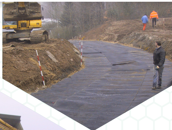
Vejarmeringsprojekt samt parkeringsplads med anvendelse af EXPO-NET armeringsnet

EXPO-NET leverede i denne forbindelse hhv. EXPO-1211 samt EXPO-1311 armeringsnet med henblik på at stabilisere og forstærke vej og parkeringsanlæg.