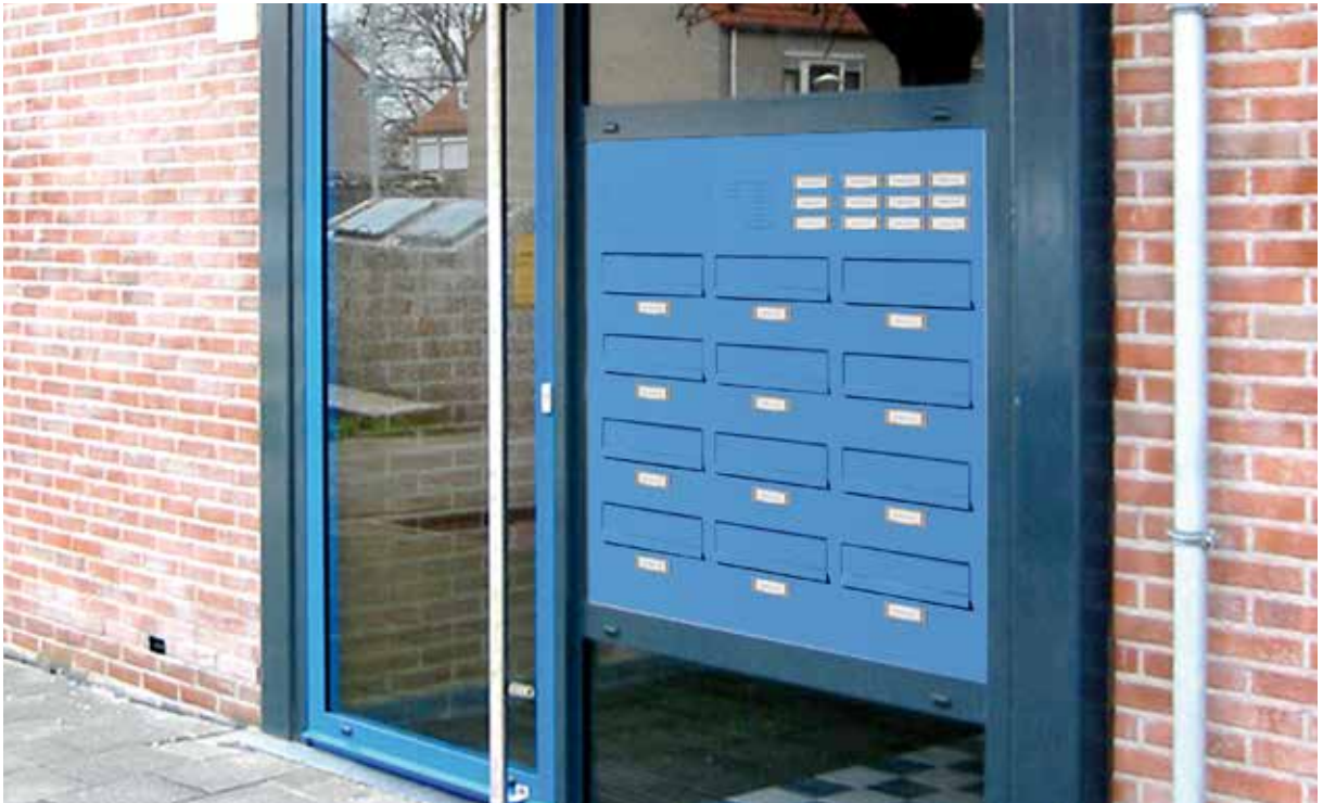
Renz postkasseanlæg H: 110 i special RAL