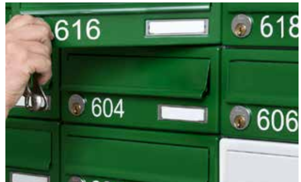
Miljøbilleder med udpluk af de mange specialfarver