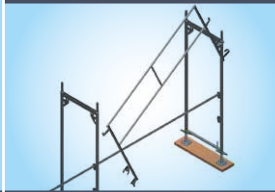
Montage af I-gelænderet fra et sikkert ståsted