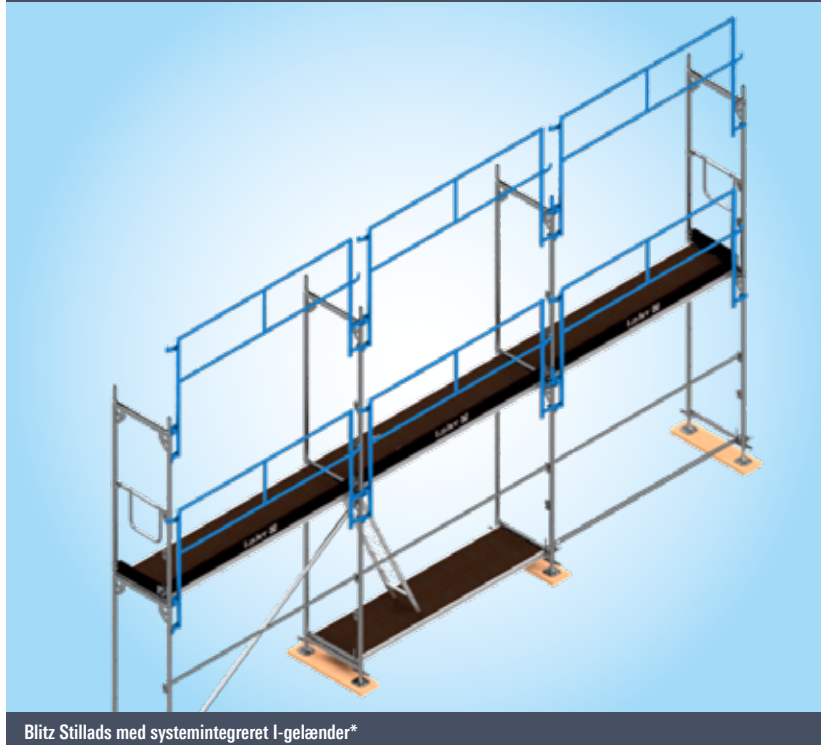
Blitz Stillads med systemintegreret I-gelænder*