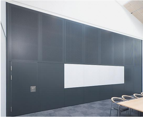
Habila600 – med white board og akustikregulerende overflade