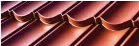
Terra cotta mat