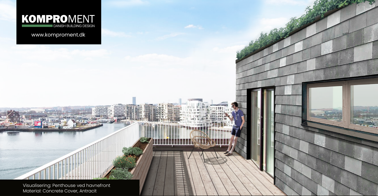
Visualisering: Penthouse ved havnefront Material: Concrete Cover, Antracit