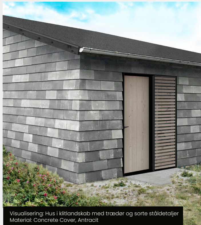
Visualisering: Hus i klitlandskab med trædør og sorte ståldetaljer Material: Concrete Cover, Antracit