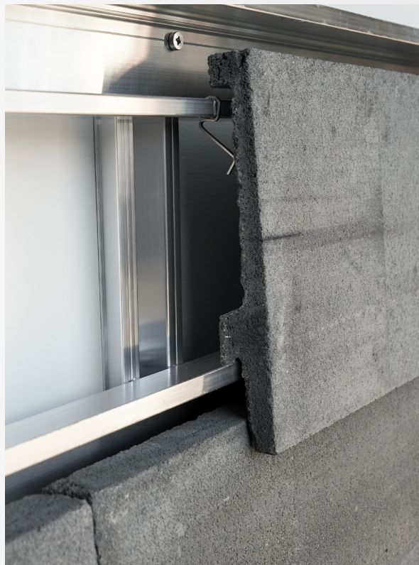
Detalje: Monteret sten

FARVE: Standard (Grey) + 3 specialfarver