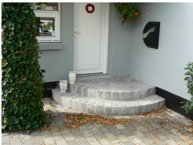
Specialfremstillet trappetrin til stålvanger