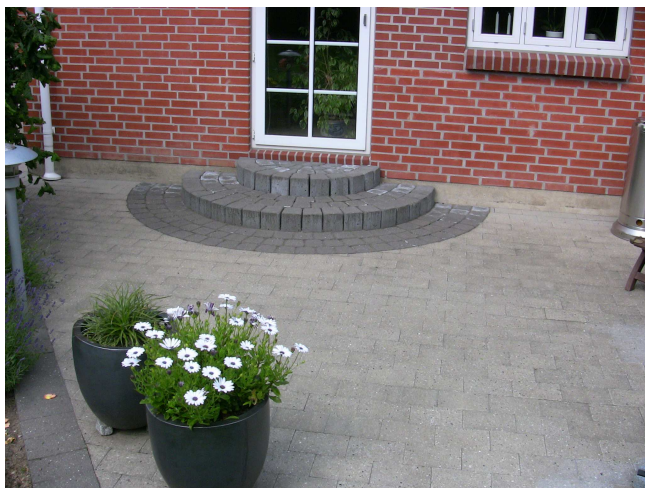
Specialfremstillet trappe m. frilagt granit