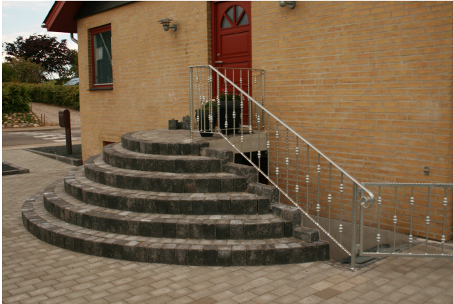
Rund trappe frilagt m. sort/antrasit granit