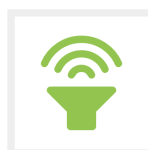
Up to 30%