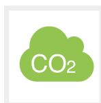
Saving of CO2