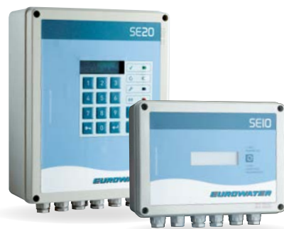
SE10- og SE20-styring.

Den enkle brugerflade gør det nemt at kontrollere opsætning af parametre og styre drift og regeneration.